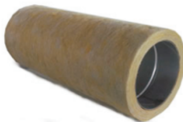
Nerezová vložka osazená do

V případě, že rozměr zděného komínu je dostatečně velký, je vhodné nerezovou komínovou vložku osadit do izolační skořepiny. Izolace má tl. 25mm. Pro její použití musí být tedy komín větší alespoň o 60mm, než je vnitřní průměr vložky. V tomto případě je vhodné použít již zmíněnou sponu. Spona se aplikuje cca každé 3-4 výškové metry. Izolace zajistí stabilnější teplotu spalin, tedy optimální tah a snížení kondenzace.