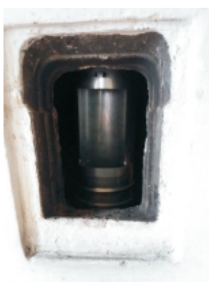
Osazení čistícího prvku