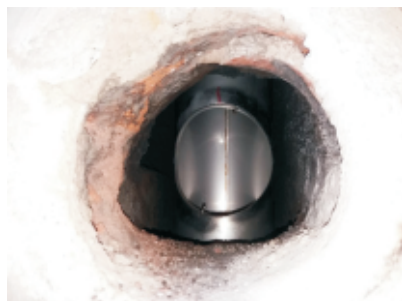
Osazený T-klix bez vodorovné části