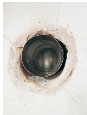
Osazený T-klix s vodorovnou částí