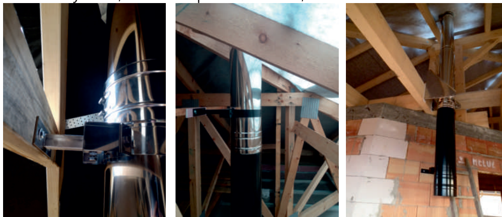
různé varianty upevnění komínu

Při průchodu střešní konstrukcí je třeba se zaměřit na možnost posledního uchycení komínu před jeho průchodem střešní krytinou a nad ní. Dále nabízíme systémové průchodky střešní krytinou, ukončení pomocí stříšek, hlavice.