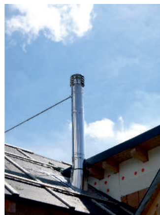
ukončení komínu Hubo hlavice

Řešení pomocí kouřovodu s funkcí komínu je stále používanějším řešením. Při dodržení všech požadavků bezpečnosti, požární ochrany je vhodné do každého typu současné, moderní stavby.