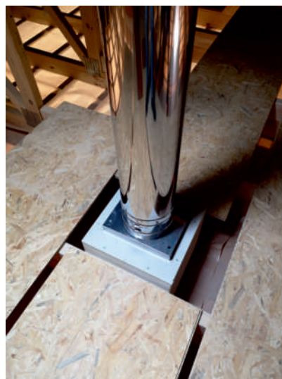
osazená průchodka LUX-NOVA