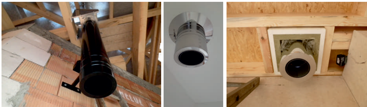
spodní ukončení komínu dvoustěnná přechodka

U řešení kouřovodu s funkcí komínu je ve spodní části osazena speciální dvoustěnná přechodka, která umožňuje dopojení spotřebiče pomocí kouřovinových tvarovek, ale i v případě krbové vložky s obestavbou použití nerezových dílů.