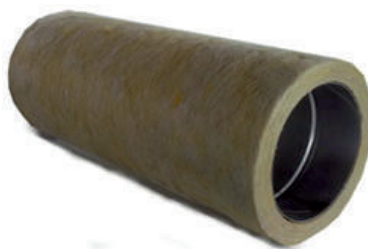
Nerezová vložka osazená do izolace

V případě, že rozměr zděného komínu je dostatečně velký, je vhodné nerezovou komínovou vložku osadit do izolační skořepiny ( FU3925 ). Izolace má tl. 25mm., zajistí stabilnější teplotu spalin, tedy optimální tah a snížení kondenzace. Pro její použití musí být tedy komín větší alespoň o 60mm, než je vnitřní průměr vložky. V tomto případě je také vhodné pro vystředění použít sponu ( FU40 ). Spona se aplikuje cca každé 3-4 výškové metry.