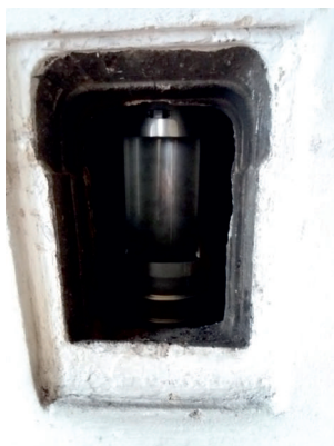
Osazení čistícího prvku