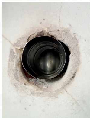
Osazený T-klix s vodorovnou částí