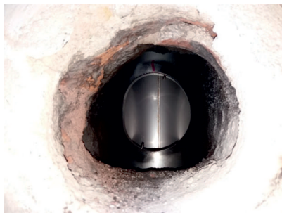
Osazený T-klix bez vodorovné části